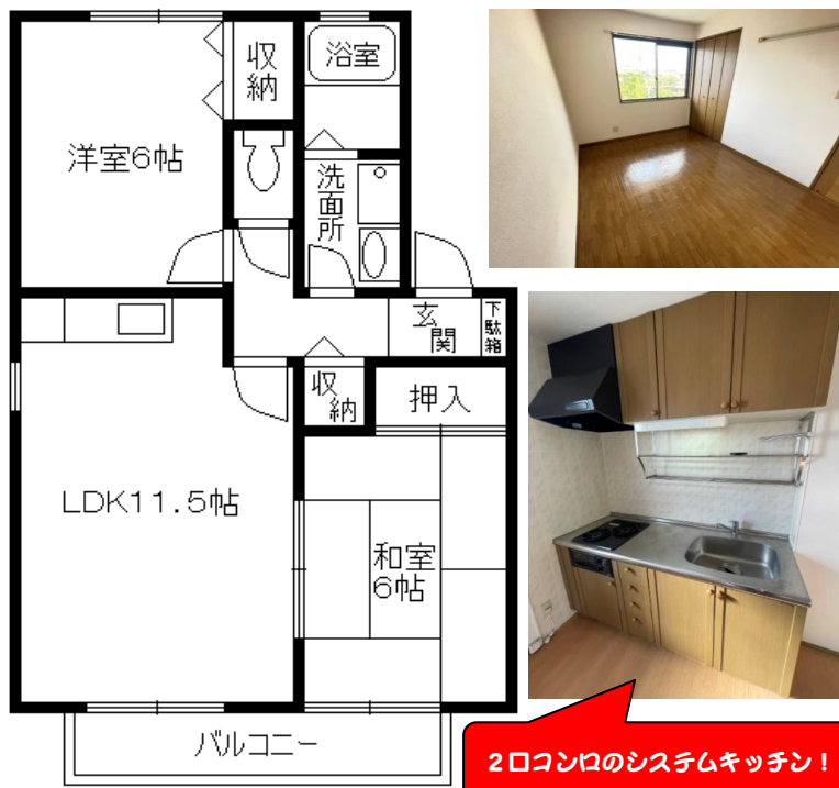
2口コンロのシステムキッチン!