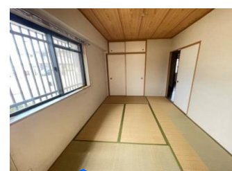
和室6帖に押入有り！